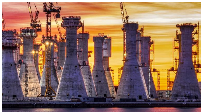
56 installed GEDA 500 Z/ZP