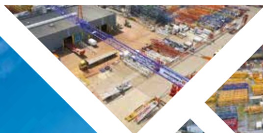
Site Paal - Belgique