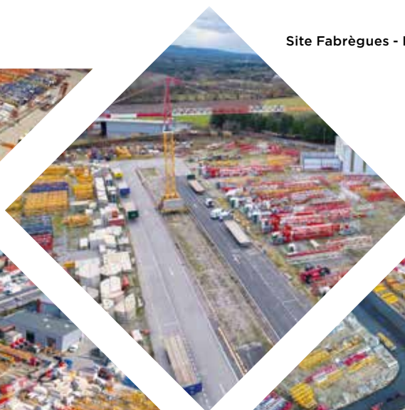
Site Fabrègues - France