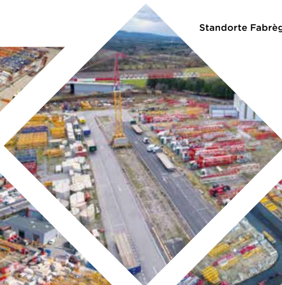
Standorte Fabrègues - Frankreich