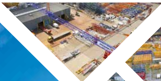
Standorte Paal - Belgien